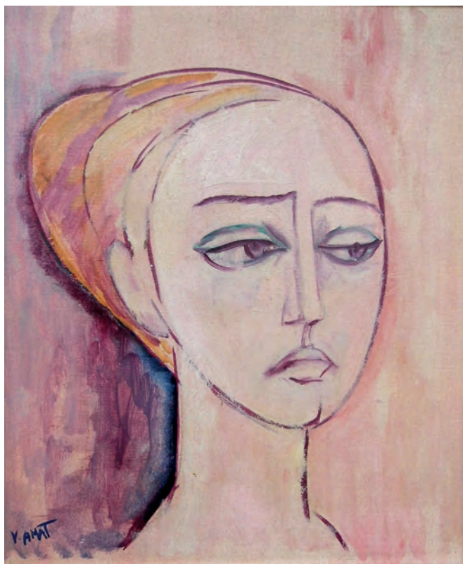
Dolor profundo de mujer. 1963. 46 x 38 cm