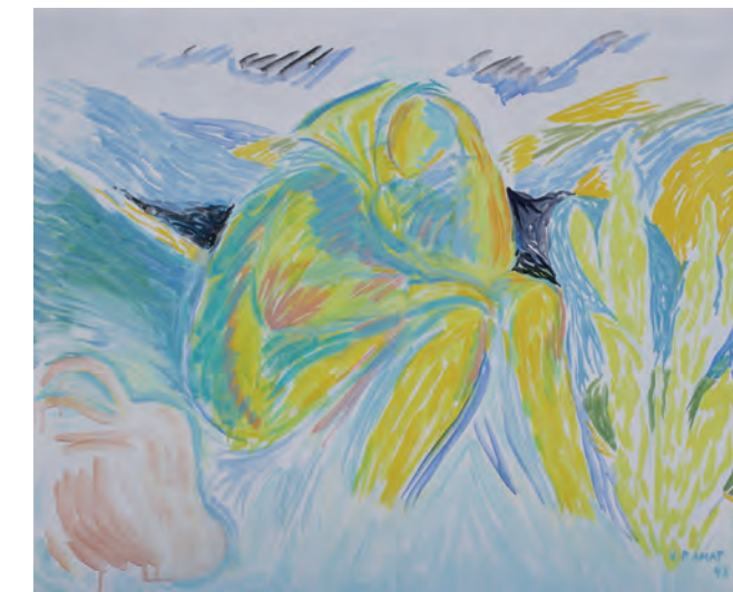
Montserrat transferrada. 1992. 73 x 60 cm