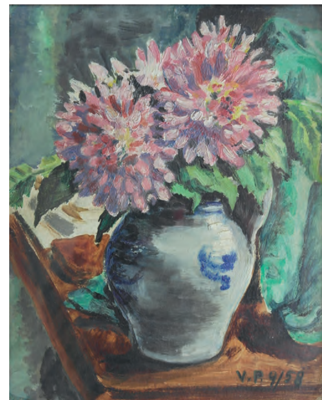
Dalias. 1958. 22 x 30 cm