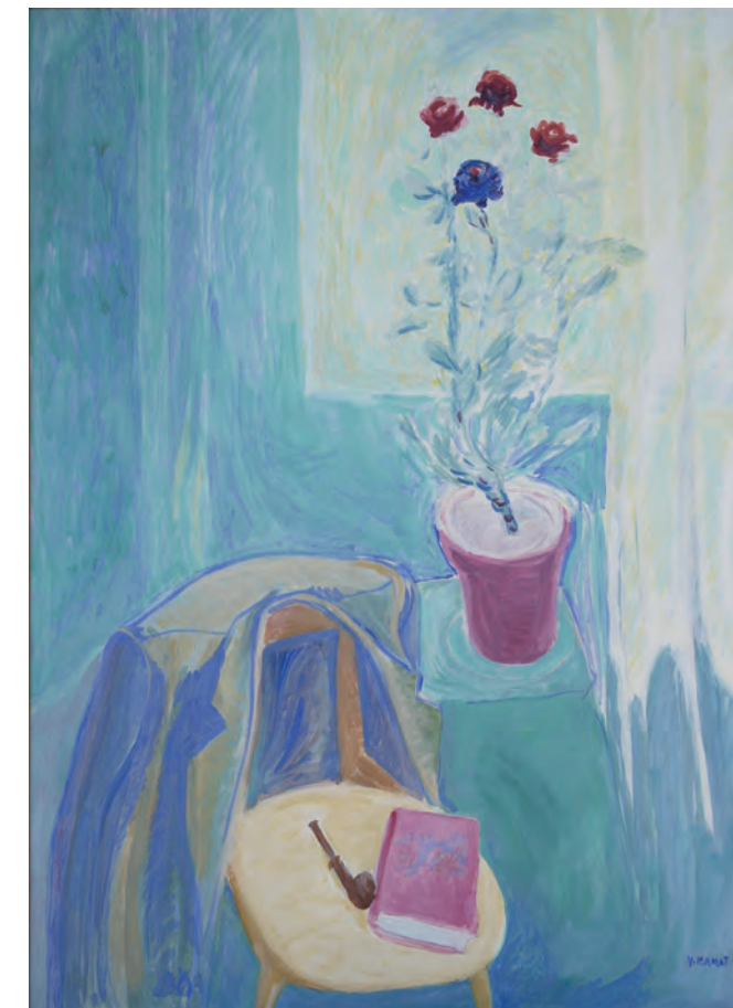
La Chaqueta. 1992. 100 x 73 cm