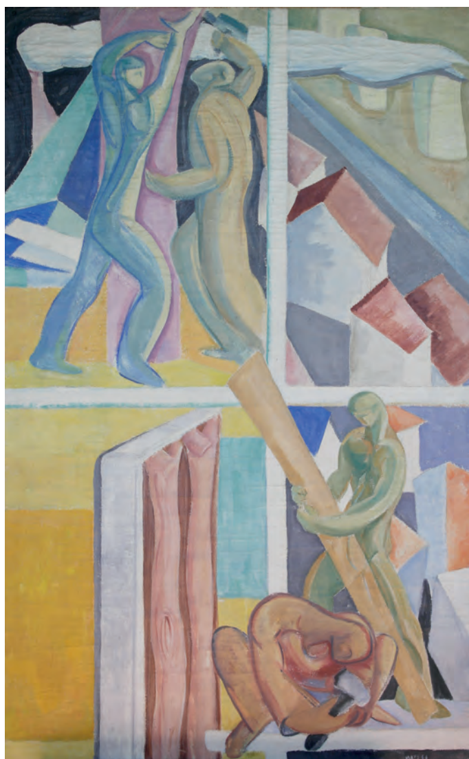
Constructores. 1966. 86 x 139 cm