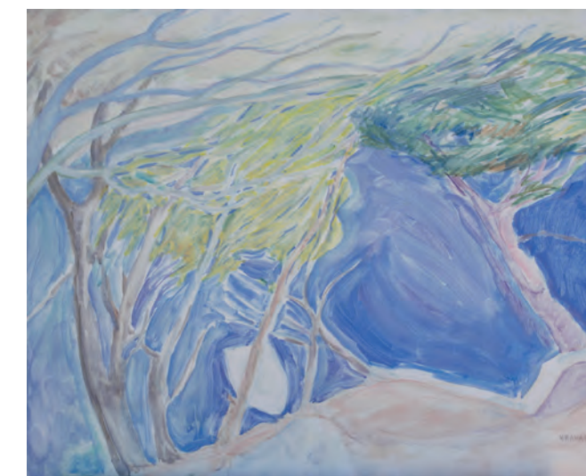
La Balada de la Isla III - Cala profunda peinada por el viento. 1998. 74 x 60 cm