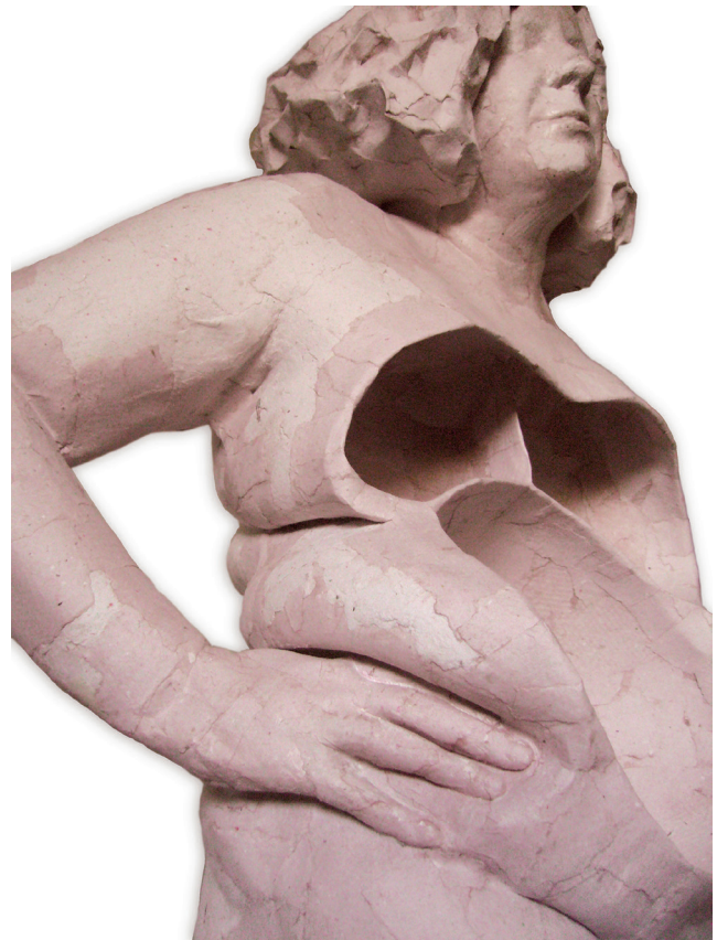
Projecte Anatòmica · Lib. III. La Venus anatòmica, cos del desig

Escultura Cartró pedra 159 x 82 x 59 cm 2011