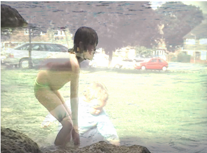
Aquí en aquest racó petit (2024)

Aquesta exposició s'emmarca en la col·laboració establerta entre la Fundació Felícia Fuster i el Grup d'Innovació Docent Consolidat Art, Professi3 i Docència (Facultat de Belles Arts, UB), amb la programació d'exposicions de l'alumnat de diferents nivells del grau en Belles Arts.