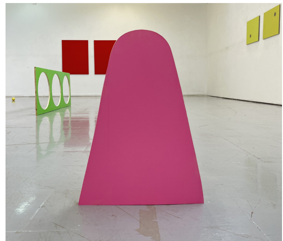
Roses (2023) Part del projecte Puzzle Pintura acrílica sobre fusta Dimensions variables

La pràctica artística de Laura Albajar gira entorn la investigació intuïtiva sobre els jocs i els patrons través de la pintura expandida. Treballa navegant la pintura monocromàtica i minimalista per tal d'anar desenvolupant diferents conceptes dins del mateix llenguatge i entén la seva pràctica artística com un constant desenvolupament d'un llenguatge abstracte que grans trets el color dins i fora del llenç.