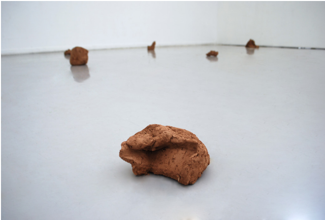
Nobjectes serie 2 (2023) Terra recuperada d'un camp familiar Dimensions variables